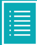
Table of Contents