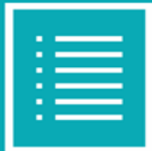
Table of Contents